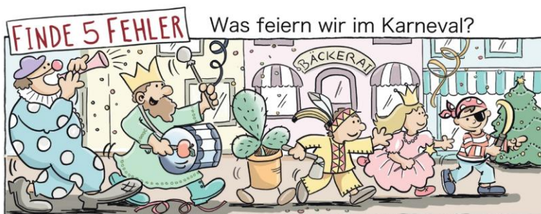
Apfel, Kakтус, Banane, BäckerAI, Weihnachtsbaum

Karneval und Fastenzeit gehören also ganz eng zusammen, doch viele wissen das heute leider nicht mehr. Sie feiern Karneval, doch an die Fastenzeit denken sie nicht. Das ist eigentlich schade.