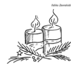
2. Advent: Die Erwartung wecken